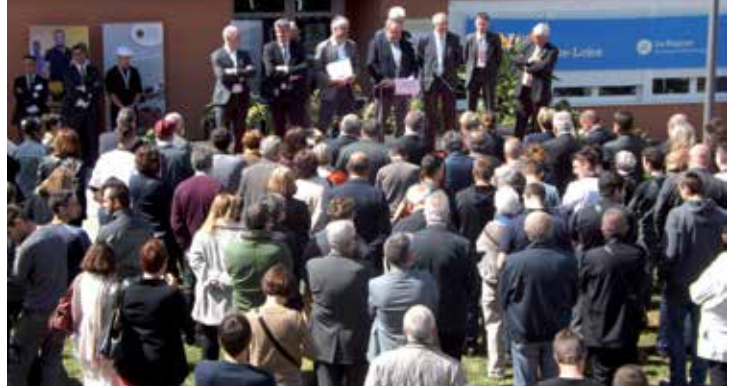
Pendant les discours

Vendredi 14 avril, avait lieu l'inauguration du nouvel ensemble de bâtiments des CFA de Bains. Le président de Région, Laurent Wauquiez, entouré des élus des collectivités territoriales, des entreprises ayant participé à la construction, des financeurs, des enseignants et des apprentis a inauguré le campus des centres de formations.