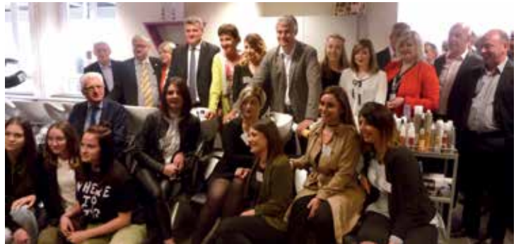
Les élus sont allés à la rencontre des apprentis pendant l'inauguration, ici en section coiffure

Symbole de l'inauguration, les apprentis des deux structures ont réalisé une œuvre commune : « l'arbre des métiers » représentant l'ensemble des formations dispensées au sein des CFA (cf. photo de couverture).